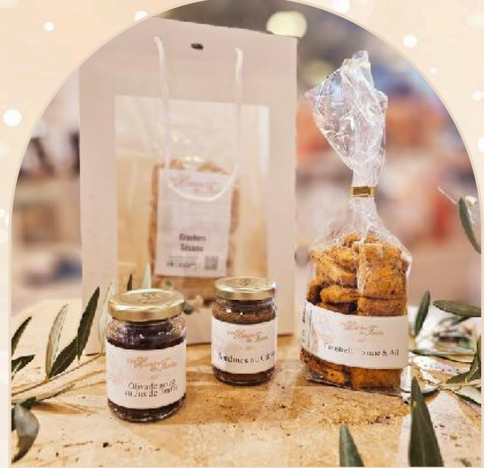
Panier salé B : 19.04€ht