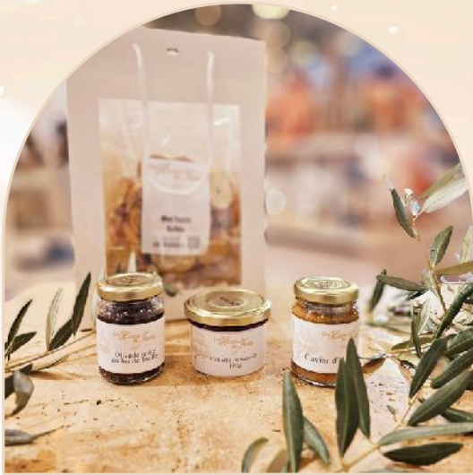
Panier salé A : 18.90€ht