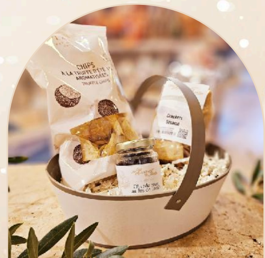
Panier salé C : 18.52€ht